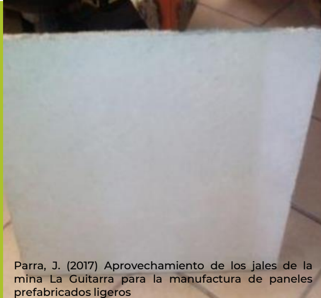
Parra, J. (2017) Aprovechamiento de los jales de la mina La Guitarra para la manufactura de paneles prefabricados ligeros